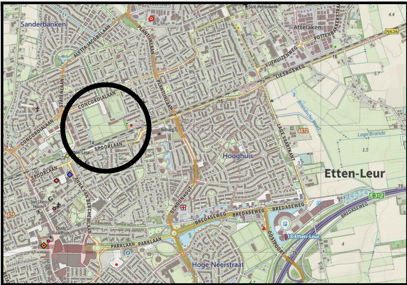
Overzicht van de situatie